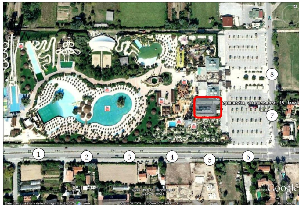
Mappa dei punti di misura